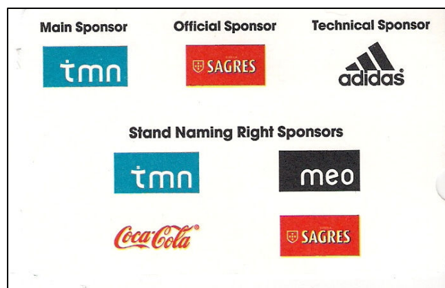
(fig. 4) Verso do Bilhete →