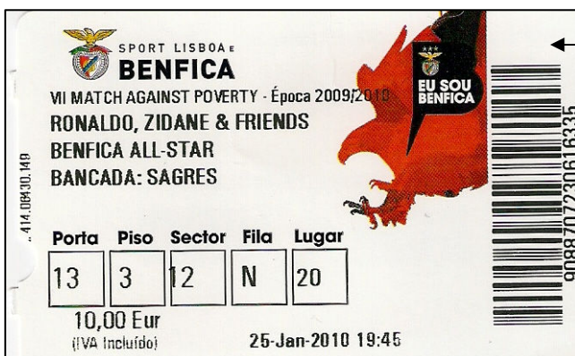
(Fig.3) Bilhete que deu acesso á entrada para ver o jogo que o Sport Lisboa Benfica organizou em solidariedade com o povo do Haiti

diz o povo "Uma desgraça não vem só" o Haiti sofre um violento sismo que acaba de derrubar a capital Porto Príncipe. Felizmente muitos países reapoderam aos apelos de ajuda humanitária, prometendo fundos, diversas expedições de rasgaste, equipas médias e engenheiros. Segundo notícias que nos tem chegado através da imprensa, o país ficou sem sistemas de comunicação, transportes aéreos, terrestres e aquáticos. A maioria dos hospitais e redes eléctricas foram todos danificados. A razão deste meu artigo é para salientar A ATITUDE DE SOLIDARIEDADE FEITA PELO SPORT LISBOA E BENFICA , tendo organizado um jogo que opôs velhas glórias e muitas estrelas do Benfica que muitas glórias deram ao clube, e os Amigos de Zidane, cujo o resultado foi o menos importante ficando empatados a 3-3 mas o que é de destacar foi A RECEITA DESTA JOGO AONDE FORAM VENDIDOS CERCA DE 60.000 BILHETES QUE RENDEU MEIO MILHÃO DE EUROS, SENDO TODA DOADA AO POVO DO HAITI . O Benfica como clube multidesportivo, com um historial invejável, com um passado cheio de muitas glórias mais uma vez demonstrou que através dos todos os elementos do Benfica, jogadores, direcção, funcionários sócios e simpatizantes que estão sempre presente a ajudar nestas iniciativas de solidariedade. Não é por acaso que o SPORT LISBOA E BENFICA É CONSIDERADO A NIVEL MUNDIAL COMO UM DOS MELHORES CLUBES DO MUNDO, E FOI CONSIDERADO PELA "IFFHS" COMO O NONO MELHOR CLUBE DO SÉCULO XX.